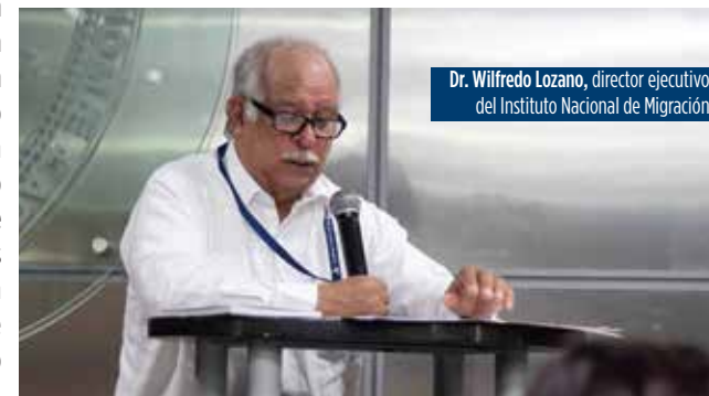
Dr. Wilfredo Lozano, director ejecutivo del Instituto Nacional de Migración

La condición de género juega un papel determinante para la mujer migrante, pues al tiempo en que tal condición es manejada en las sociedades receptoras como mecanismo de exclusión y desigualdad, es transformada como recurso de ciudadanía e identidad que ayuda a la mujer inmigrante a su reconocimiento en la sociedad de acogida [...]. Todos los procesos la autora los ilustra con el caso español, a propósito de los esfuerzos organizacionales y participativos de la mujer inmigrante de España.