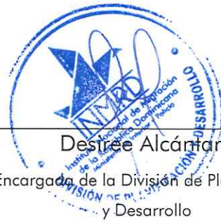
Desirée Alcántara Encargada de la División de Planificación y Desarrollo